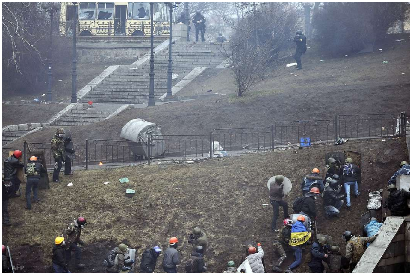
Наступ майданівців на вул. Інститутській.

Протестувальники відтіснили силовиків до Міжнародного центру культури і мистецтв Федерації профспілок України (Жовтневого палацу). Після цього, за інформацією, оприлюдненою в рішенні суду щодо розстрілів 20 лютого 2014 року учасників масових протестів, заступник командира полку «Беркуту» Олег Янішевський прийняв рішення застосувати силу проти активістів, щоб звільнити майданчик біля Жовтневого палацу та прикрити відступ силовиків, які перебували у будівлі. Бійці так званої чорної роти «Беркуту» відкрили вогонь на ураження проти беззбройних людей.