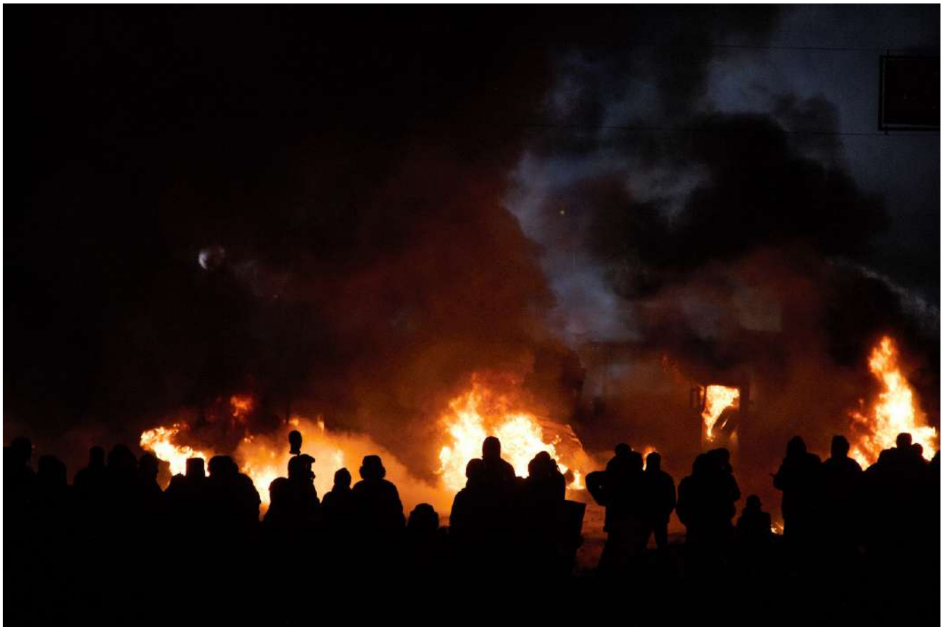
«Вогнехрещца» на Грушевського.

Ухвалення «диктаторських законів», зміст яких відверто суперечив принципам демократії, призвело до радикалізації протестів. На черговому вічі 19 січня 2014 року частина його учасників, обурена згаданими законами та бездіяльністю опозиційних лідерів, вирушила до будівлі Верховної Ради. На початку вулиці Михайла Грушевського шлях їм перекрили міліція та «Беркут». Майже відразу почалися сутички. Лінія протистояння пролягла між колонадою стадіону «Динамо» та будівлею Національного художнього музею України. Міліція застосувала світлошумові гранати й інші спецзасоби. Із боку протестувальників полетіли петарди та «коктейлі Молотова». Два міліцейські автобуси, які перекривали шлях колоні, було перекинуто та спалено. Щоб стримати спроби наступу силовиків, протестувальники склали з підпалених шин вогняну барикаду. Утворилася щільна димова завіса. Міліція вдалася до помпових рушниць і водометів усупереч закону, який забороняє використовувати водомети за температури нижчої від нуля градусів за Цельсієм. Цей і наступні дні протистояння на вулиці Михайла Грушевського увійшли в історію під назвою «Вогнехрещца».