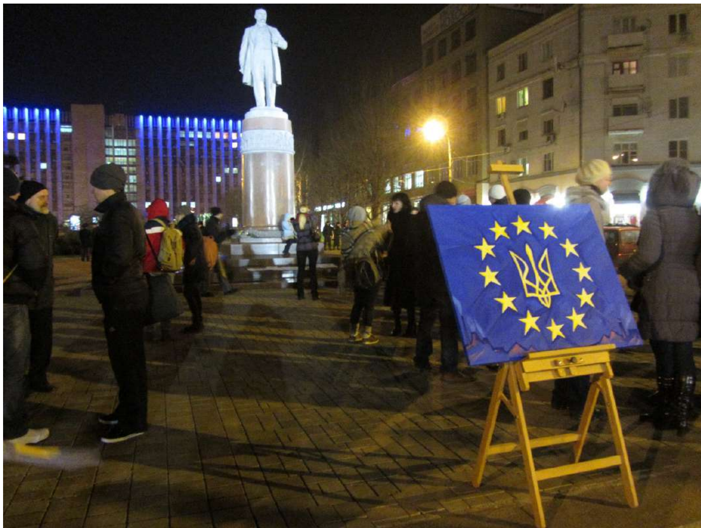
Євромайдан у Донецьку. 25 листопада 2013 року.

Акції з вимогою підписати Угоду про асоціацію з ЄС відбулися також у багатьох країнах світу, де жили українці. Зокрема українська діаспора Італії, Франції, Німеччини, Великої Британії, Чехії, Польщі, США та Канади 23–24 листопада організувала мітинги, на яких люди висловлювалися на підтримку Євромайдану та виступали за укладення Угоди про асоціацію.