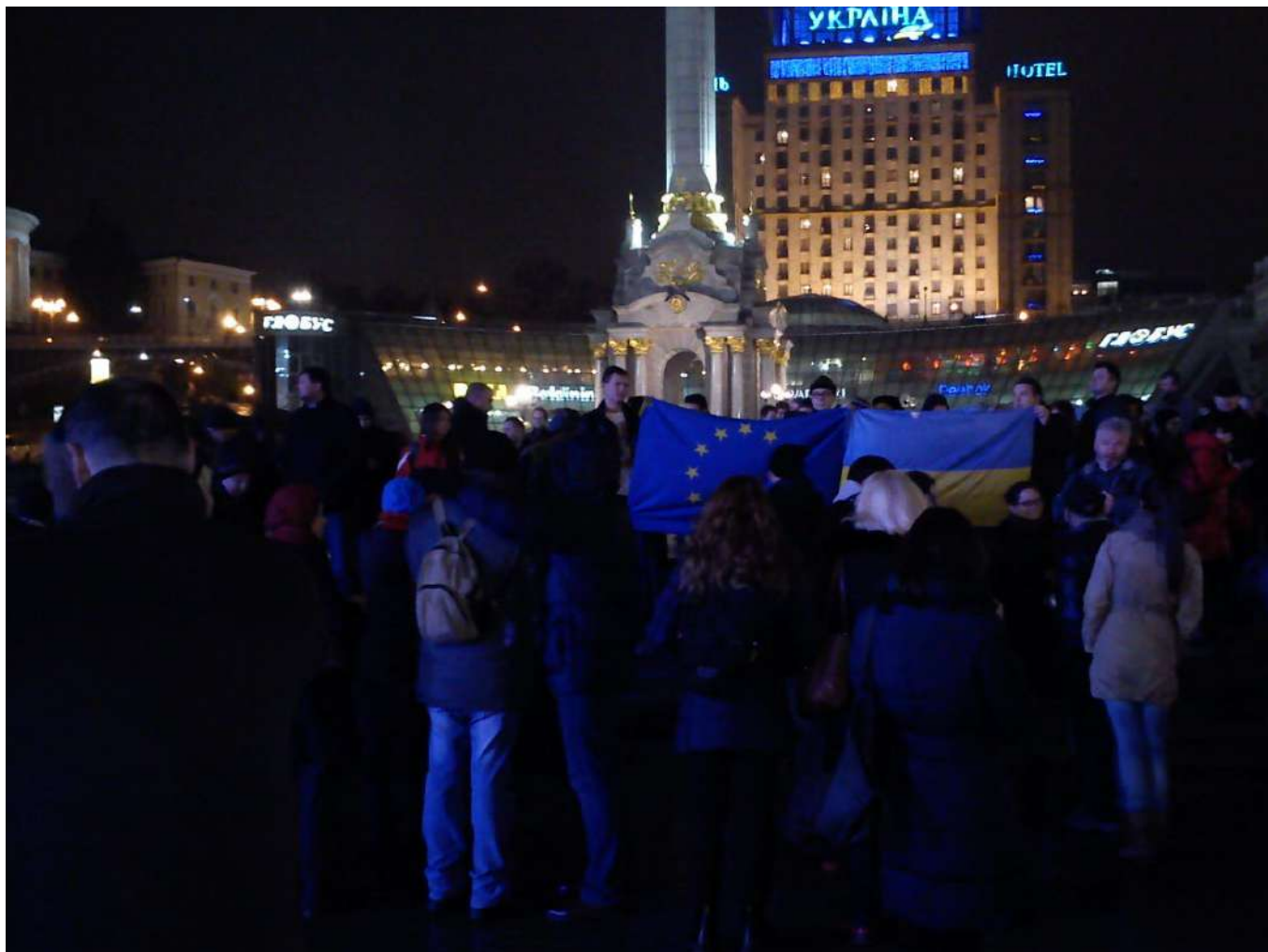
Початок Євромайдану. 21 листопада 2013 року.

За інформацією «Української правди», ближче до півночі на головній площі Києва зібралось близько 1500 осіб із прапорами України та Євросоюзу. Від майдану Незалежності вони вирушили на вулицю Банкову, яку заблокували силовики. Заспівавши гімн України під Адміністрацією президента, люди повернулися на центральну площу. Частина з них залишилася на майдані Незалежності до ранку, тим самим заявивши, що протест буде безстроковим. Маніфестантів підтримали деякі опозиційні політики, які також вирішили чергувати вночі на Майдані з метою захисту протестувальників.