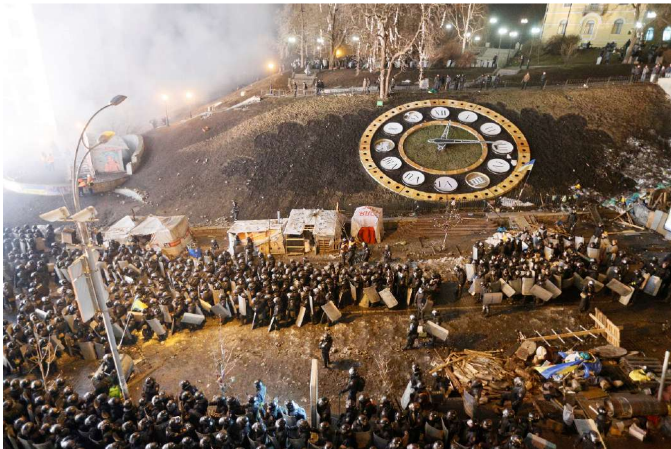
Штурм Майдану. Вечір 18 лютого 2014 року.