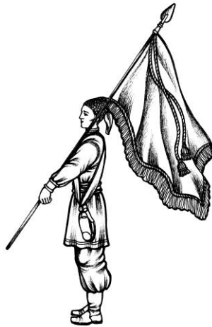
Мал.2. Положення Козацької Хоругви на плечі