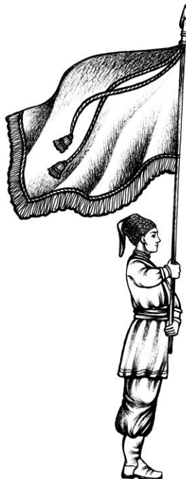
Мал.3. Постава Козацької Хоругви для руху урочистим ходом