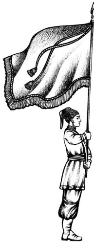
Мал.3. Постава Козацької Хоругви для руху урочистим ходом