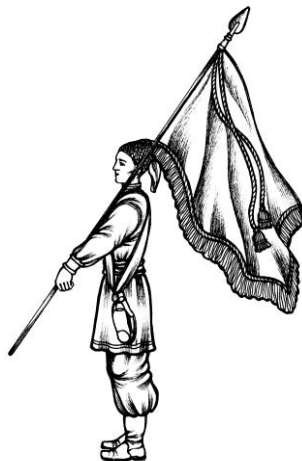
Мал.2. Положення Козацької Хоругви на плечі