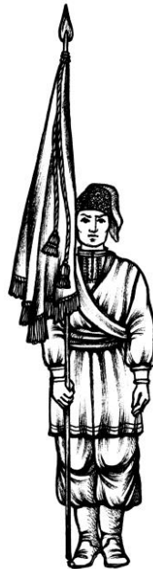
Мал.1. Постава Козацької Хоругви в ладі на місці

Під час проходження урочистим ходом Козацьку Хоругву несуть, як показано на мал. 3.