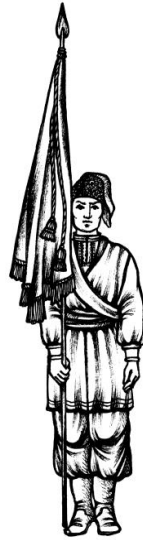
Мал.1. Постава Козацької Хоругви в ладу на місці

Під час проходження урочистим ходом Козацьку Хоругву несуть, як показано на мал. 3.